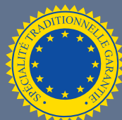
LES PRODUITS BÉNÉFICIAINT D'UNE SPÉCIALITÉ TRADITIONNELLE GARANTIE (STG)

54 produits bénéficient de la mention STG en Europe, tels que la mozzarella en Italie, le jambon Serrano en Espagne ou la moule de Bouchot en France.