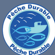
LES PRODUITS ISSUS DE LA PÊCHE MARITIME BÉNÉFICIAINT DE L'ÉCOLABEL PÊCHE DURABLE

Les produits issus d'une exploitation bénéficiant de la certification environnementale de niveau 2 entrent également dans le décompte uniquement jusqu'au 31 décembre 2029.